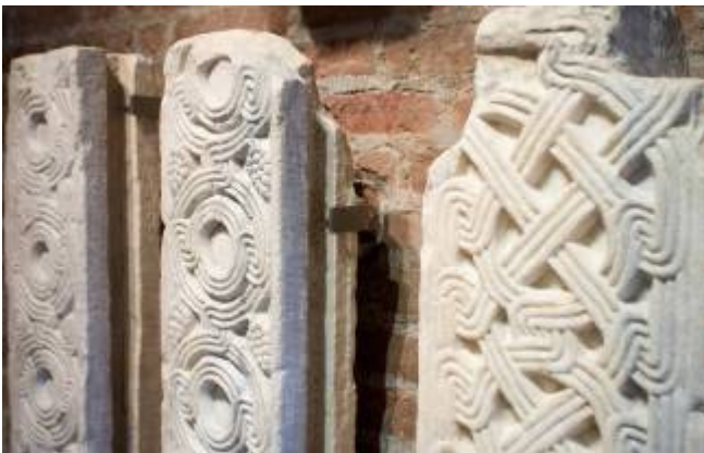
Tre lastre transenna IX secolo Dalla chiesa di San Salvatore di Torino Acquisto 1876 382-383-384/PM Lapidario Medievale 1