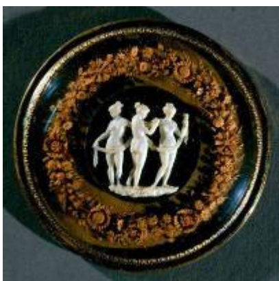
Francesco Tanadei Le tre grazie Inizio del XIX secolo Avorio e legno su ebano e pergamena, cornice in rame dorato Lascito Beccaria 1897 56/AV

Settecento gli ebanisti Luigi Prinotto e Pietro Piffetti presero parte al rinnovo dell'arredo delle residenze sabaude introducendo a corte il gusto per il mobile decorato ad intarsio con legni rari, madreperla e avorio. Mentre Prinotto, nominato mastro ebanista nel 1712, utilizzò spesso i disegni del pittore Pietro Domenico Olivero per la composizione delle scene di genere che ornano i suoi mobili, Piffetti coniugò armoniosamente invenzioni autonome e citazioni di stampe di autori vari con composizioni floreali barocche di gusto franco-fiammingo