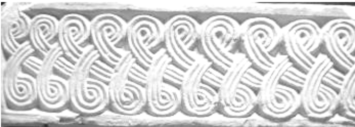
Frammento di lastra Prima metà VIII secolo Dall'abbazia della Novalesa. Acquisizione non precisata, in Museo dal 1875 168/PM Lapidario Medievale 1