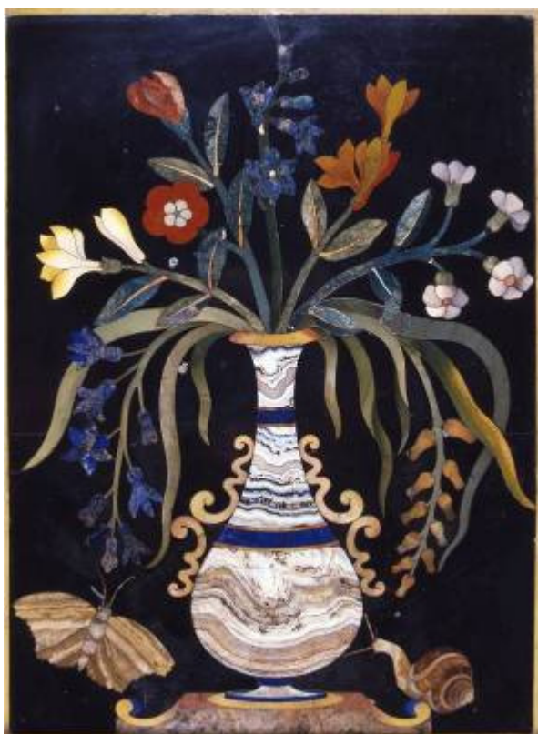
Manifattura fiorentina medicea Vaso di fiori Ultimo quarto del XVI secolo Commesso di pietre dure Acquisto, 1892 297/PM