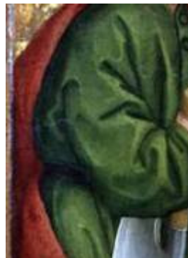
Antoine de Lonhy Sei tavole di polittico con gli apostoli Matteo, Giacomo Maggiore, Pietro, Giacomo minore, Simone e Andrea 1462-1470 circa Tempera e oro su tavola Acquisto 2000, 5 Sala Acaia