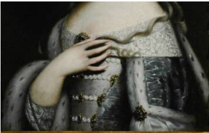
Pittore attivo alla corte di Savoia Ritratto di Maria Giovanna Battista di Savoia-Nemours Fine del XVII secolo olio su tela 700/D Primo Piano, Gabinetto Rotondo

L'identificazione del ritratto si basa sul confronto col ritratto della duchessa dipinto da Giovanni Caracca nel 1585, oggi al Museo di Casa Cavassa a Saluzzo. Caterina Micaela, andata in sposa l'11 marzo 1585 al duca Carlo Emanuele I, è ritratta a tre quarti di figura, in vesti preziose, adorna di perle, accanto a un vaso di fiori di foggia ancora decisamente manierista; sullo sfondo si apre uno scorcio sulla galleria che univa Palazzo Madama, allora castello degli Acaia, al Palazzo del vescovo, intorno al quale sarebbe sorto il nuovo Palazzo Ducale di casa Savoia.