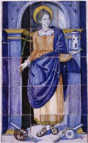
Fabbrica di Savona o Albissola Santa Barbara 1525-1530 Terracotta smaltata Da Issel (Genova) Acquisto non precisato, 1884 3503/C Piano Terra, Biglietteria