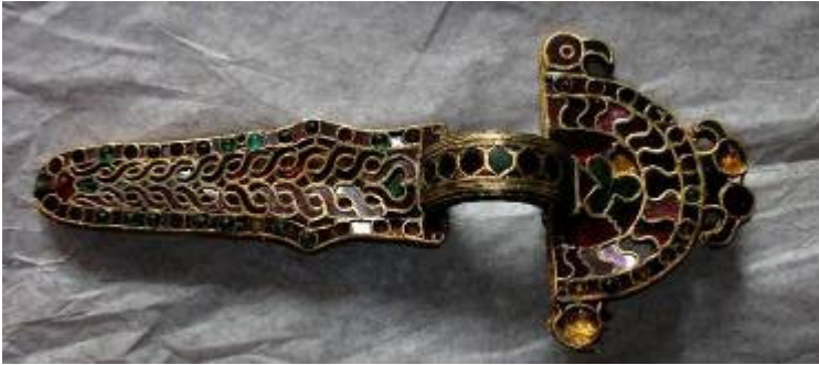
Arte ostrogota di area italica Fibula a staffa. Tesoro di Desana Inizio del V secolo Oro, argento, almandini, pietre verdi Acquisto 1938 30/Ori Torre Tesori Piano Fossato