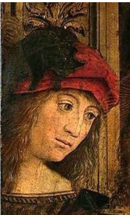
Defendente Ferrari Chivasso, 1480/1485- dopo il 12 novembre 1540 Lo sposalizio della Vergine 1504 circa Tempera su tavola Dono Vincenzo e Maria Fontana in memoria del padre Leone Fontana, 1909 433/D Sala Acaia

tensione verso l'astrazione geometrica e la razionalità prospettica. Il ritratto è uno dei dipinti più celebri della storia dell'arte, come rappresentativo documento d'incontro tra la cultura nordica, che fa capo a Van Eyck, e quella del Rinascimento italiano.