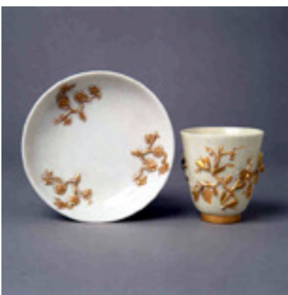
Fabbrica di Capodimonte Tazza e piattino XVII secolo Porcellana Dono d'Azeglio, 1875 2502/C Sala Ceramiche