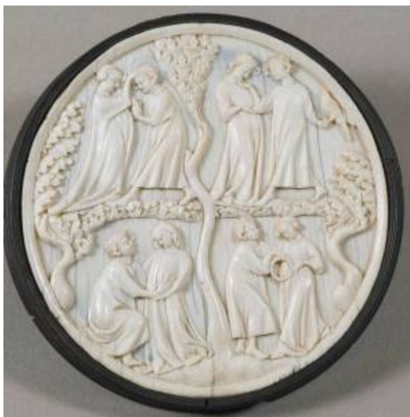
Parigi Valva di scatola per specchio con quattro scene galanti 1300-1330 circa Avorio Cambio con il Museo Egizio 1871 Dalle collezioni dei duchi di Savoia 152/AV Sala Vetri e Avori