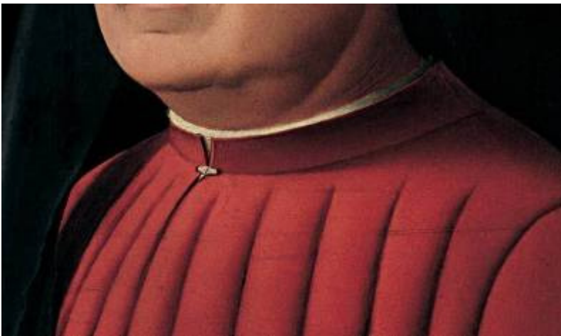
Antonello da Messina Messina circa 1430-Messina 1479 Ritratto d'uomo 1476 Olio su tavola Ceduto dalla Città di Milano, 1935 437/D Torre Tesori Piano Terra

L'opera, firmata e datata 1476, è uno dei risultati più alti della carriera del pittore, impegnato nella ricerca di un equilibrio tra la rappresentazione analitica desunta dai fiamminghi e la