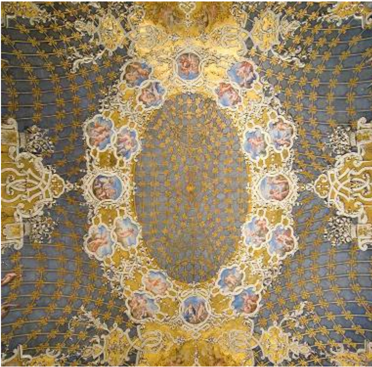
Soffitto di Sala Quattro Stagioni

Il nome della sala deriva dall'iconografia della cartelle angolari dorate che ospitano le allegorie delle quattro Stagioni. L'elaborata decorazione della volta eseguita a stucco e affresco fu realizzata tra il 1708 e il 1715 attingendo ai modelli decorativi di Jean Bèrain, architetto e disegnatore ornamentale francese alla corte di Luigi XIV. Nel primo Settecento l'ambiente era denominato "Gabinetto grande del Circolo" e aveva la funzione di anticamera per la stanza da letto di Madama Reale.