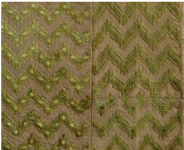
Manifattura italiana Frammento Fine del XVI - inizio del XVII secolo Velluto cesellato a corpo 1733/C

variante con corpo cilindrico, a decorazione meno regolare e colori diversi era già diffusa in periodi più antichi (VIII-X secolo).