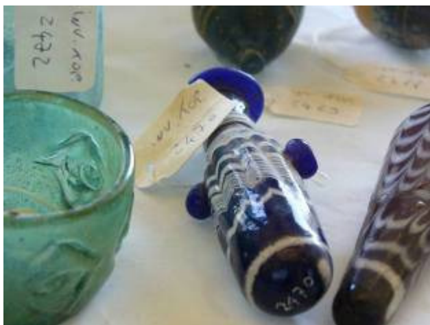
Egitto o Siria Bottigliette e Balsamari IX-XII secolo Vetro Sala Vetri e Avori

Le bottigliette per i profumi e per gli unguenti erano molto diffuse, sia quelle decorate durante la lavorazione a vetro soffiato, sia quelle decorate ad applicazione su vetro colorato con un filo opaco bianco, lavorato a festoni e marmorizzato nel corpo della bottiglietta. Il genere di decorazione a festoni su fondo scuro con festoni regolari appartiene al periodo islamico medievale (XI-XII secolo), mentre la