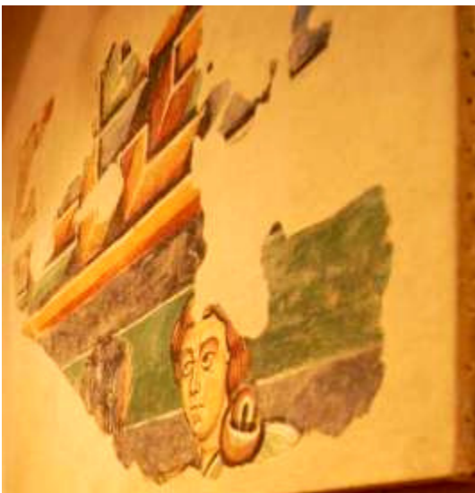
Pittore lombardo Due frammenti di affresco strappato dal sottotetto della cattedrale di Santa Maria ad Acqui con offerta di Caino e decorazione a greca 1067 (?) Torino, Soprintendenza per i Beni Architettonici e del Paesaggio in Piemonte s.n. Lapidario Medievale 4

La pittura romanica, che deriva dai modelli bizantini, si caratterizza per la ieraticità delle figure, le ampie campiture di colore e per i bordi tracciati con spesse linee nere.