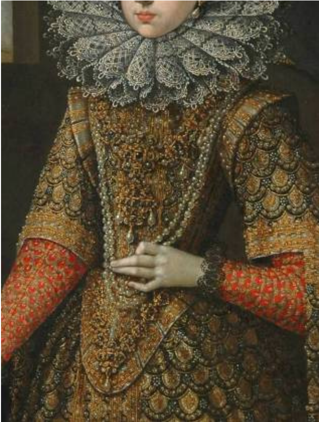
Ignoto ritrattista attivo alla corte sabauda alla fine del XVI secolo Ritratto di Caterina Micaela d'Austria, moglie di Carlo Emanuele I 1590-1595 Olio su tela 580/D Primo Piano, Gabinetto Rotondo

L'identificazione del ritratto si basa sul confronto col ritratto della duchessa dipinto da Giovanni Caracca nel 1585, oggi al Museo di Casa Cavassa a Saluzzo. Caterina Micaela, andata in sposa l'11 marzo 1585 al duca Carlo Emanuele I, è ritratta a tre quarti di figura, in vesti preziose, adorna di perle, accanto a un vaso di fiori di foggia ancora decisamente manierista; sullo sfondo si apre uno scorcio sulla galleria che univa Palazzo Madama, allora castello degli Acaia, al Palazzo del vescovo, intorno al quale sarebbe sorto il nuovo Palazzo Ducale di casa Savoia.