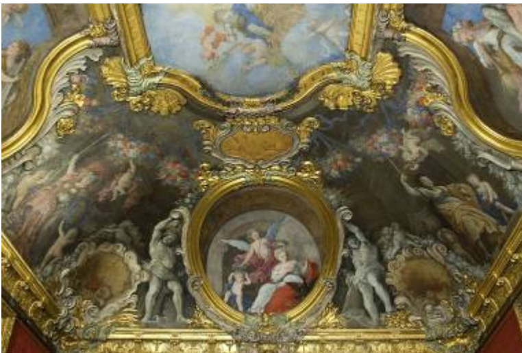
Soffitto di Camera di Madama Reale

Il nome della sala deriva dall'iconografia della cartelle angolari dorate che ospitano le allegorie delle quattro Stagioni. L'elaborata decorazione della volta eseguita a stucco e affresco fu realizzata tra il 1708 e il 1715 attingendo ai modelli decorativi di Jean Bèrain, architetto e disegnatore ornamentale francese alla corte di Luigi XIV. Nel primo Settecento l'ambiente era denominato "Gabinetto grande del Circolo" e aveva la funzione di anticamera per la stanza da letto di Madama Reale.