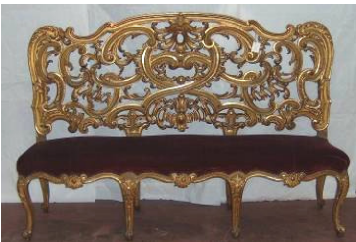
Ignoto intagliatore piemontese (su disegno di Filippo Juvarra ?) Serie di otto divani Inizio XVIII secolo Legno intagliato e dorato, velluto cremisi Dal Municipio di Torino, 1908 (1307-1313/L) Acquisto 1961 (1306/L) Primo Piano Sala Feste