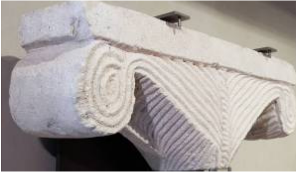
Capitello VIII secolo Pietra scolpita Acquisizione non specificata, forse 1905 133/PM Lapidario Medievale 1

Tra la fine dell'ottavo e l'inizio del nono secolo, il movimento detto "iconoclasta" (movimento di carattere religioso sviluppatosi intorno alla prima metà del secolo VIII. Alla base di questo movimento stava la convinzione che la venerazione delle immagini sacre spesso sfociasse in idolatria. Questa convinzione provocò la distruzione materiale di un gran numero di immagini sacre) decise a rimuovere dalle rappresentazioni sacre ogni riferimento alla figura umana, favoriva l'adozione di motivi decorativi tratti dal mondo vegetale o dalla stilizzazione geometrica.