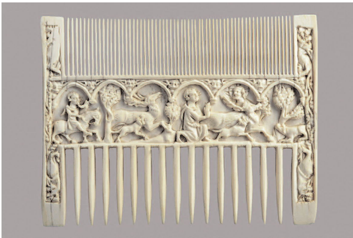
1. Pettine con storie di sant'Eustachio, Francia (Parigi?), metà o terzo quarto del XIV secolo, intaglio in avorio, faccia anteriore. Torino, Palazzo Madama - Museo Civico d'Arte Antica, inv. 149/AV.