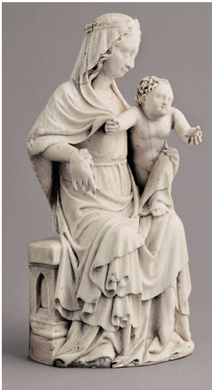
7. Madonna col Bambino , Inghilterra (?), inizi del XV secolo, intaglio in avorio. Torino, Palazzo Madama - Museo Civico d'Arte Antica, inv. 98/AV.

Avvolto da un lembo del velo, che lascia scoperto il busto e le braccia massicci, il Bambino poggia il piede sinistro sul trono, il destro sulla gamba della madre, in un movimento di torsione che lo porta a volgere all'osservatore il viso pieno sotto le fitte ciocche scomposte. La base della statuetta presenta al centro un foro riempito con un perno ligneo; la superficie è fittamente graffiata, come di norma, per facilitare l'adesione a un supporto. Gli orli del velo di Maria, danneggiato sulla destra in corrispondenza della nuca, e i fioroni della sua corona sono consunti; tracce di consunzione sono visibili sulla parte sinistra della nuca del Bambino e sui capelli della Vergine, vicino alla