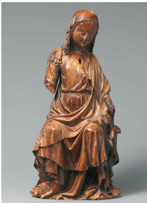
8. Madonna col Bambino , dettaglio della mano destra della Madonna.