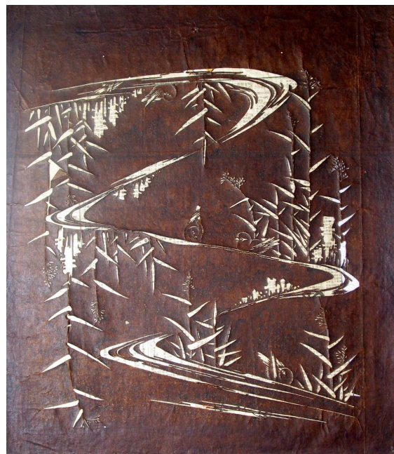
8. Katagami con paesaggio con bambù Giappone, secolo XIX carta di gelso impermeabilizzata con shibu , tagliata 478 x 410 mm Torino, GAM - Galleria Civica d'Arte Moderna e Contemporanea, alt/221