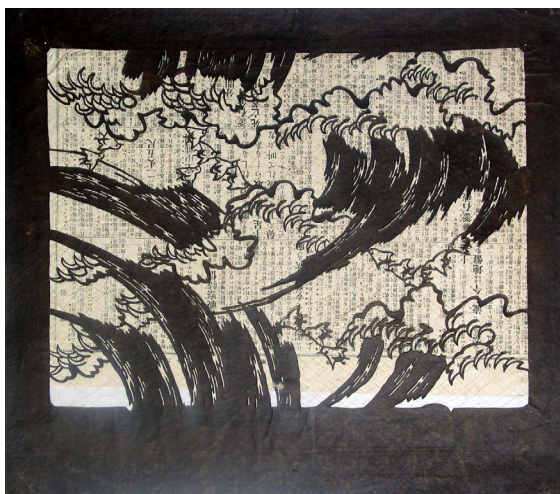
6. Katagami con onde e uccelli Giappone, secolo XIX carta di gelso impermeabilizzata con shibu , tagliata, capelli 377 x 424 mm Torino, GAM - Galleria Civica d'Arte Moderna e Contemporanea, alt/219