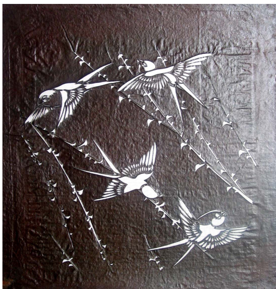
9. Katagami con rondini Giappone, secolo XIX carta di gelso impermeabilizzata con shibu , tagliata 422 x 410 mm Torino, GAM - Galleria Civica d'Arte Moderna e Contemporanea, alt/222