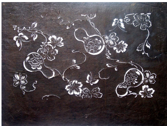
3. Katagami con zucche Giappone, secolo XIX carta di gelso impermeabilizzata con shibu , tagliata 307 x 413 mm Torino, GAM - Galleria Civica d'Arte Moderna e Contemporanea, alt/216