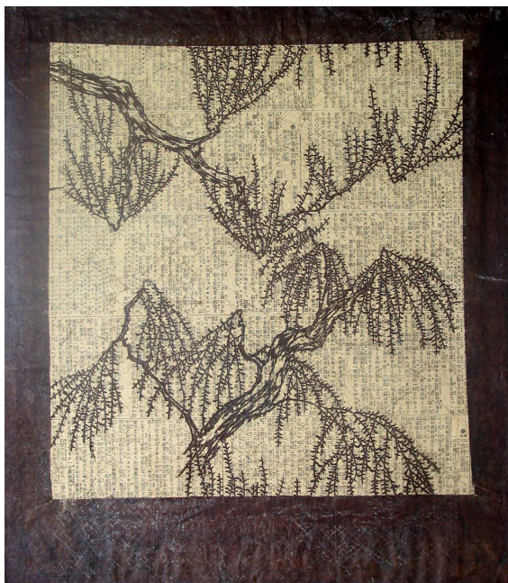
7. Katagami con salici piangenti Giappone, secolo XIX carta di gelso impermeabilizzata con shibu , tagliata, capelli 510 x 420 mm Torino, GAM - Galleria Civica d'Arte Moderna e Contemporanea, alt/220