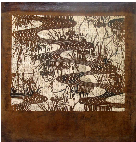
2. Katagami con iris d'acqua Giappone, secolo XIX carta di gelso impermeabilizzata con shibu , tagliata, capelli 466 x 417 mm Torino, GAM - Galleria Civica d'Arte Moderna e Contemporanea, alt/215