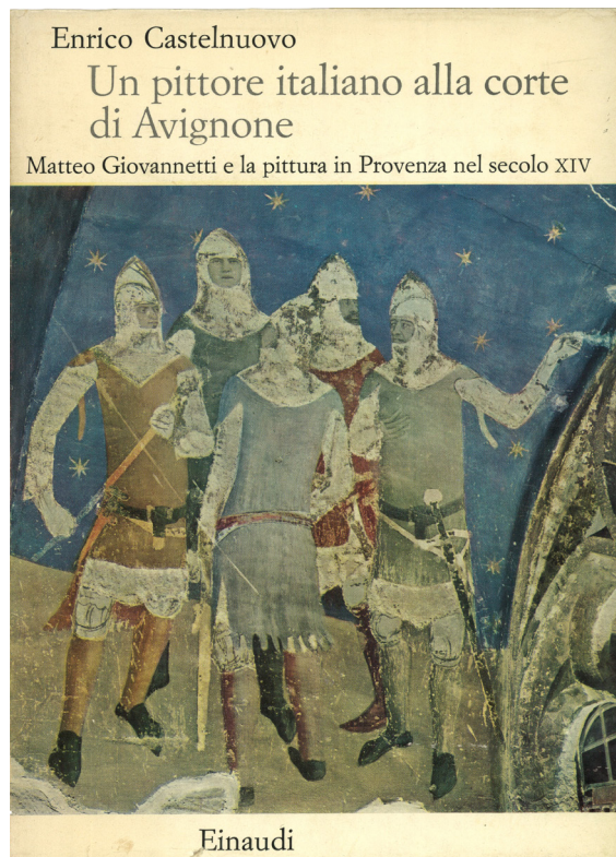
2. Enrico Castelnuovo, Un pittore italiano alla corte di Avignone , Einaudi, Torino 1962

Ma, nonostante questa propensione allo studio della storia sociale, Castelnuovo è ancora, all'altezza cronologica del suo libro, un 'soldato' parzialmente fedele e il libro, nell'impianto generale, è un volume dove l'esame dello stile, l'ecriasi, guidano i capitoli centrali della ricerca, quelli più specificatamente dedicati a mettere a fuoco gli impegni e le scelte di Giovannetti ad Avignone, del quale pure si ripercorre la formazione negli anni italiani. I fatti di stile sono restituiti quasi come un atto dovuto alla tradizione di studi da cui discende, ma si sente la spinta di nuove domande, l'attenzione per le attese della committenza. Alla corte di Avignone, Gio-