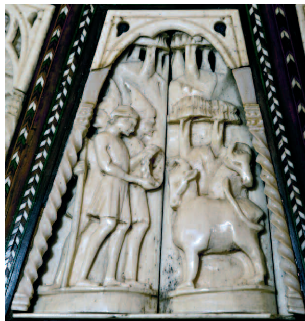
3. Bottega degli Embriachi, cofanetto con Storie di Susanna e di Paride, fine del XIV secolo-inizio del XV. Vercelli, Museo Camillo Leone, inv. 4302, particolare.