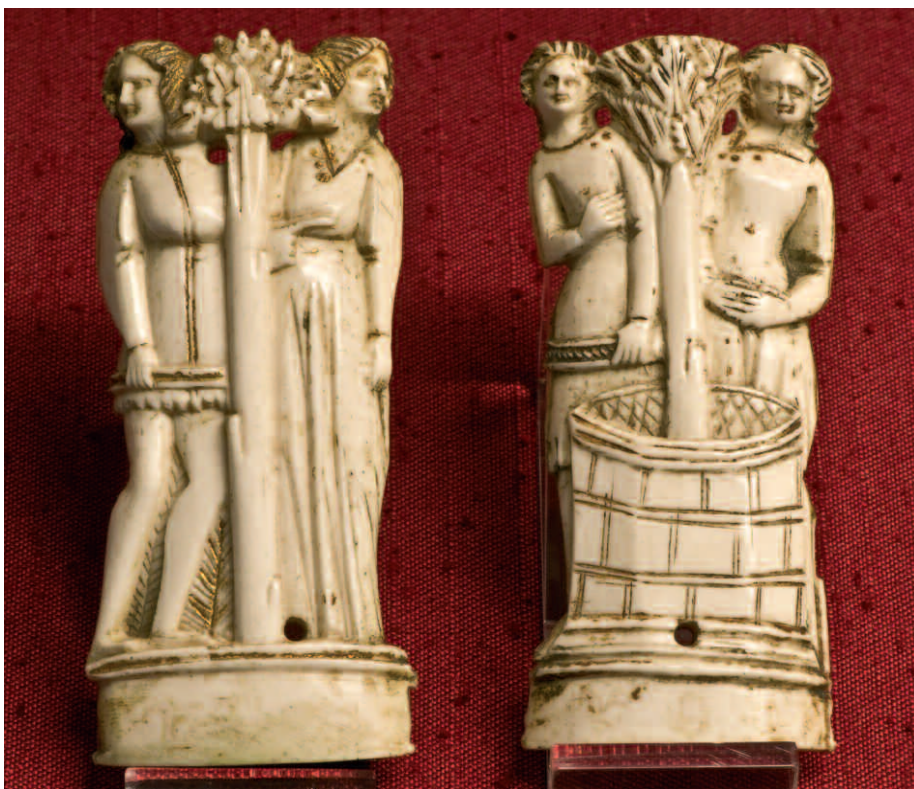
13. Bottega a figure inchiodate, frammento di cofanetto, terzo quarto del XIV secolo. Firenze, Museo Nazionale del Bargello, inv. 142 C.