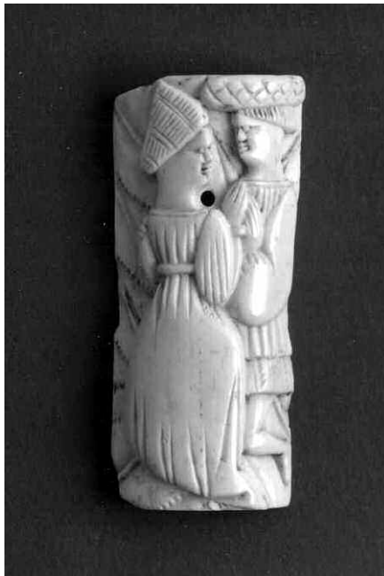
16. Bottega dell'Italia settentrionale?, placchetta frammentaria, metà circa del XV secolo. Torino, Palazzo Madama - Museo Civico d'Arte Antica, inv. 215/AV.