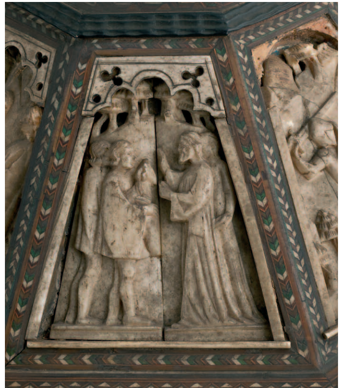
5. Bottega degli Embriachi, cofanetto con Storie di Paride e di Giasone, fine del XIV secolo-inizio del XV. Torino, Palazzo Reale, depositi, inv. 8519, particolare prima del restauro.

scene con la Storia di Susanna del forzierino vercellese – un tema iconografico assai raro all'interno della bottega, mirante a celebrare la castità e la purezza femminili 13 – possono confrontarsi con i frammenti di soggetto analogo che si conservano a Palazzo Madama a Torino (inv. 198/AV: fig. 6) e al Castello del Buonconsiglio di Trento (inv. Mun. 4072/1-14) 14 . Secondo Tomasi, questi pezzi, per le proporzioni filiformi e i movimenti dinoccolati delle figure, sono vicini al trittico a due registri del Museo Civico Medievale di Bologna (inv. 720), anche se forse non ci si può spingere fino ad ipotizzare una identità di mano, come un tempo ritenuto dallo stesso studioso 15 .