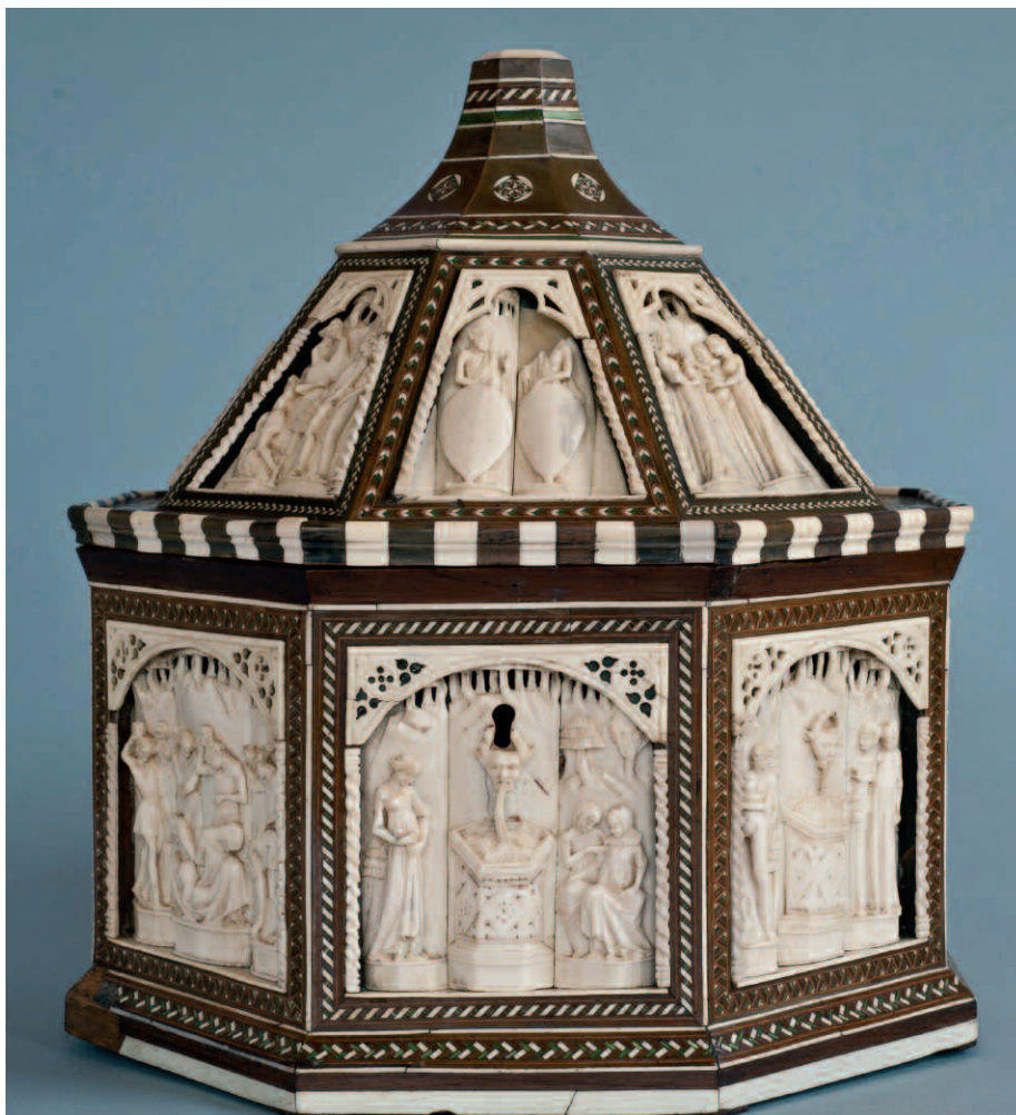
1. Bottega degli Embriachi, cofanetto con Storie di Susanna e di Paride, fine del XIV secolo-inizio del XV. Vercelli, Museo Camillo Leone, inv. 4302, intero.

Da un punto di vista stilistico, il cofanetto è un manufatto di grande qualità, uscito dalla Bottega fondata dal mercante fiorentino Baldassarre Ubriachi che, come noto, dominò il mercato della produzione di oggetti in osso e in avorio in Italia ed Europa attorno al 1400 12 . Come mi ha gentilmente comunicato Michele Tomasi, le