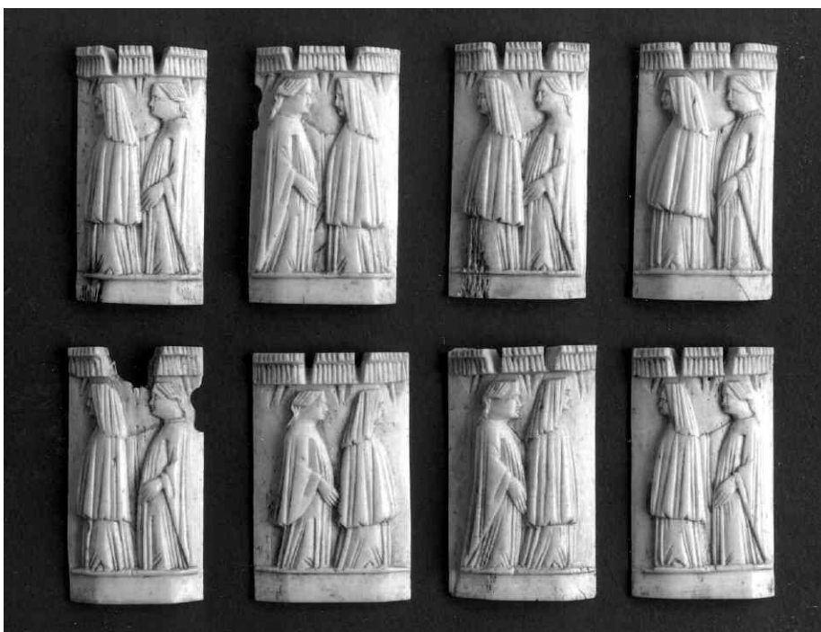
11. Bottega dell'Italia settentrionale, frammenti di cofanetto, secondo quarto del XV secolo. Torino, Palazzo Madama - Museo Civico d'Arte Antica, inv. 204/AV, 212/AV.

in quello di Torino la combinazione di due storie diverse sul corpo e sul coperchio del manufatto non è frequente all'interno della bottega 23 .