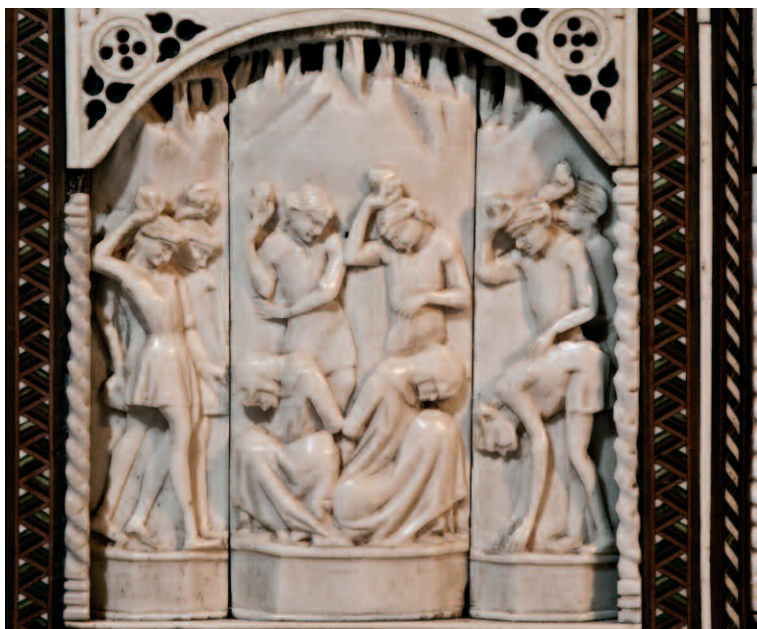
2. Bottega degli Embriachi, cofanetto con Storie di Susanna e di Paride, fine del XIV secolo-inizio del XV. Vercelli, Museo Camillo Leone, inv. 4302, particolare.