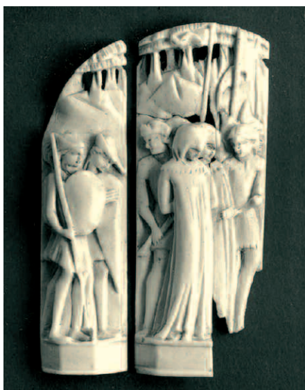
6. Bottega degli Embriachi, frammenti di cofanetto con Storie di Susanna, fine del XIV secolo-inizio del XV. Torino, Palazzo Madama - Museo Civico d'Arte Antica, inv. 198/AV.