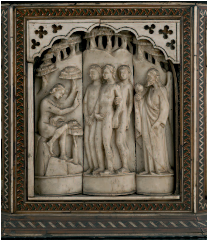
4. Bottega degli Embriachi, cofanetto con Storie di Paride e di Giasone, fine del XIV secolo-inizio del XV. Torino, Palazzo Reale, depositi, inv. 8519, particolare prima del restauro.