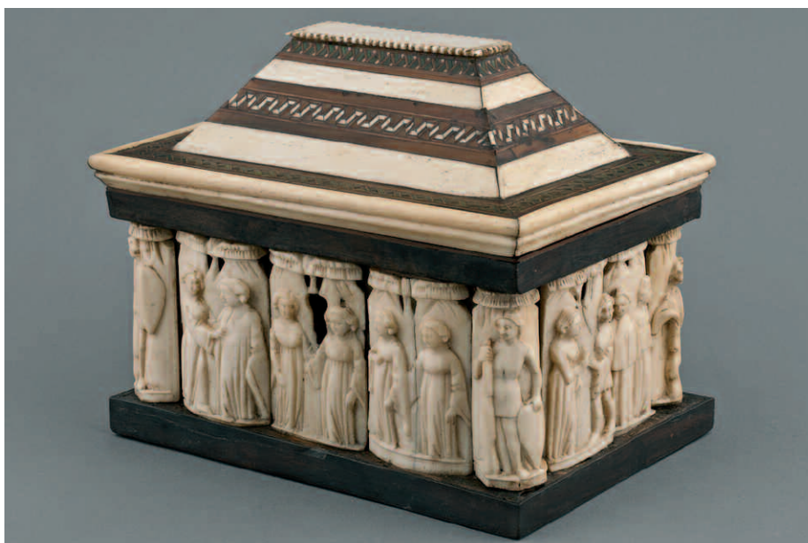
7. Bottega degli Embriachi?, cofanetto con figure appaiate, primo quarto del XV secolo. Torino, Armeria Reale, S.M. 8921.

6- (?): una figura maschile, con veste lunga, segue una figura femminile sulla destra, che sembra reggere qualcosa in mano;