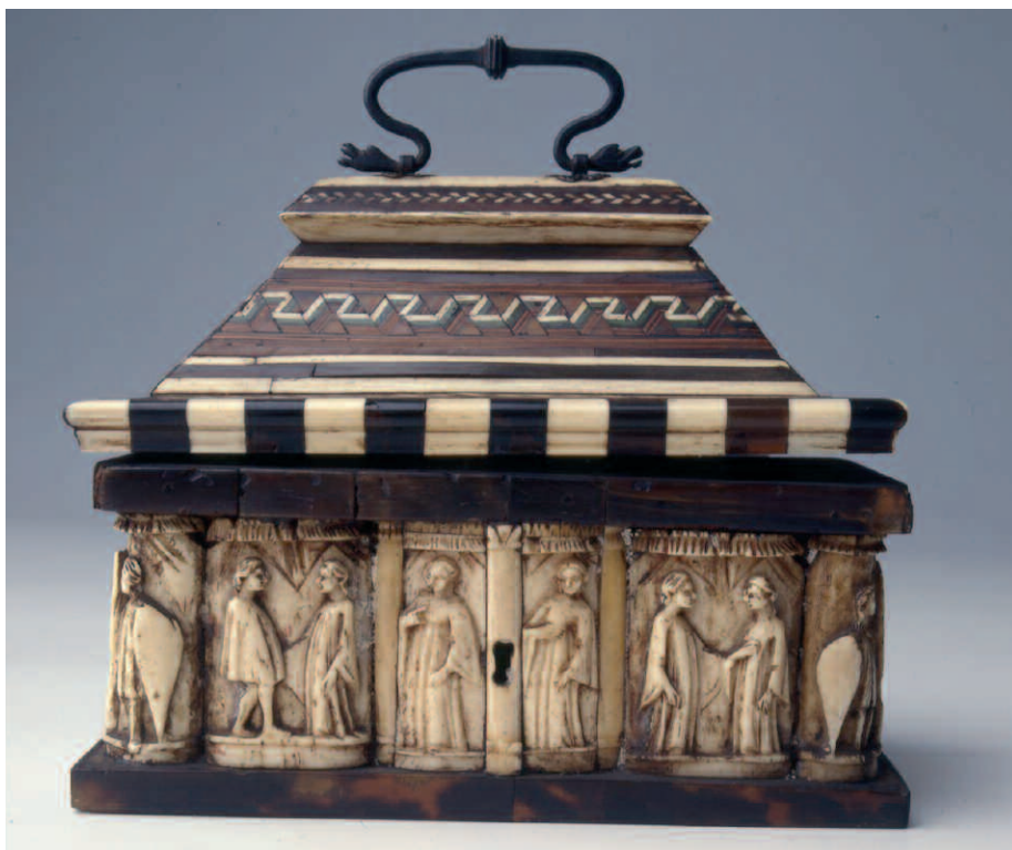
8. Bottega degli Embriachi?, cofanetto con figure appaiate, primo quarto del XV secolo. Milano, Museo Bagatti Valsecchi, inv. 756.

Il cofanetto di Palazzo Reale alla fine dell'Ottocento è citato nell'inventario del Reale Medagliere di Sua Maestà (n. 8938), dove si apprende che si trovava al primo piano del palazzo nella Sala del Medagliere: "Cofanetto in legno di forma ottagonale con 8 rilievi in avorio che girano attorno alla cassetta, con altri 8 disposti sul coperchio a comignolo. Sec. XV" 20 . Null'altro sappiamo per ora su questo manufatto che qui si presenta per la prima volta 21 . Non-