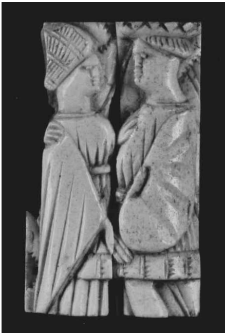
15. Bottega dell'Italia settentrionale?, placchetta frammentaria, metà circa del XV secolo. Ravenna, Museo Nazionale, inv. 5703.