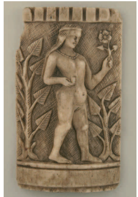
17. Bottega dell'Italia settentrionale?, placchetta frammentaria, secondo quarto del XV secolo? Domodossola, Museo Civico Gian Giacomo Galletti, inv. 3873.

nel suo articolo sugli avori del Musée Savoisien del 1881, le individuava come “parties de l'ornementation d'un de ces coffrets italiens très repandus dans toute l'Europe”, le giudicava di qualità mediocre e le assegnava al XIV secolo 36 . Tale giudizio si ritrova nel catalogo del Musée Savoisien del 1911 37 . In realtà i due frammenti, data la loro forma trapezoidale, in origine dovettero con ogni verosimiglianza far parte della cornice di uno specchio 38 . Per ciò che concerne invece iconografia e stile mi sembra che le placchette di Chambéry possano essere accostate alla placchetta, inv. 5703, del Museo Nazionale di Ravenna, attribuita nel 1993 a bottega dell'Italia settentrionale (veneta o lombarda) attiva verso la metà circa del secolo XV (fig. 15) 39 . Le coincidenze maggiori riguardano il copricapo delle dame e la costruzione per forme semplificate delle figure, che presentano volti quadrati e colli spessi e torniti. Caratteristiche stilistiche molto simili si riscontrano anche nel listello 215/AV conservato nei depositi di Palazzo Madama a Torino, ancora in