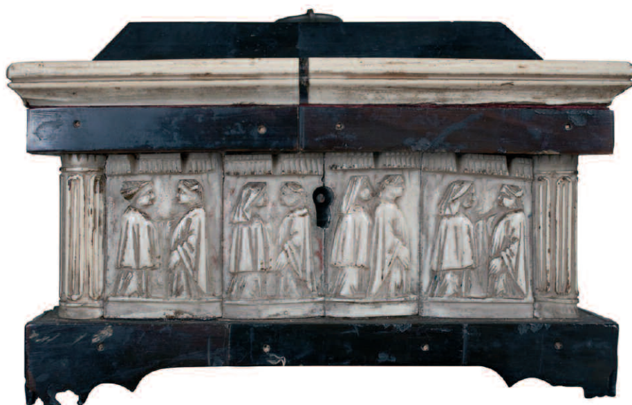
9. Bottega dell'Italia settentrionale, cofanetto con figure appaiate, secondo quarto del XV secolo. Ivrea, Capitolo della Cattedrale di Santa Maria, deposito.