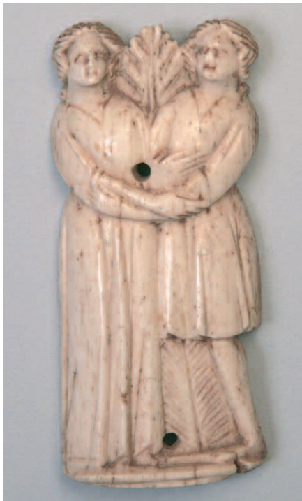
12. Bottega a figure inchiodate, frammento di cofanetto, terzo quarto del XIV secolo (1370-1390 circa). Cherasco, Museo Civico Giovan Battista Adriani, inv. 001.