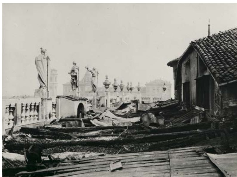
3-4. Palazzo Madama, copertura: squadre all'opera dopo il bombardamento del 13 agosto 1943. Torino, Archivio fotografico dei Musei Civici - Fondazione Torino Musei - "Danni di Guerra"

fu, come dimostra la nota scritta a matita nella richiesta di ordine: "Si accettano solo in deposito perché non sono state eseguite né a regola d'arte né come è convenuto" 16 .