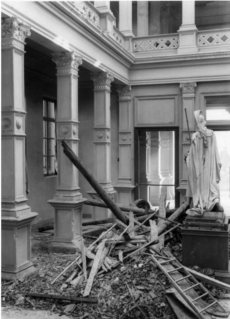
6. Torino, Galleria d'Arte Moderna, crollo della copertura.