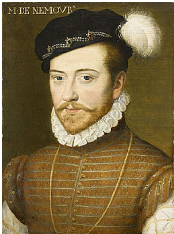
4. Marc Duval, Ritratto di Jacques de Savoie-Nemours , circa 1560, olio su tela. Chantilly, Musée Condé