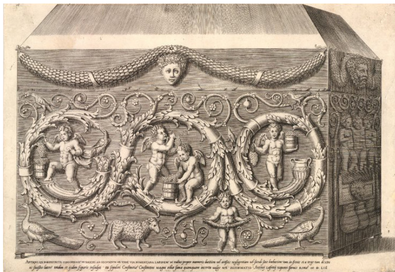
3. Sarcofago di Costanza, incisore romano, 1553, bulino, dallo Speculum Romanae Magnificentiae di Antonio Lafreri. Milano, Raccolta delle Stampe "Achille Bertarelli", Albo H 56-2, tav. 66